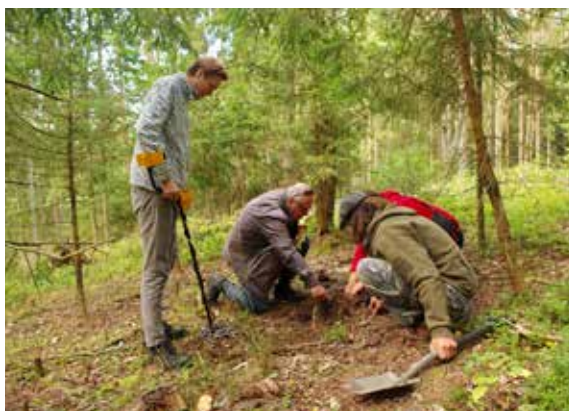
8 pav. Vanagų karinės stovyklos žvalgymų akimirka.