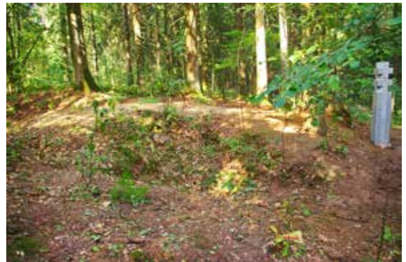
1 pav. Pamedžių (Montvidinės) miško bunkerio duobė