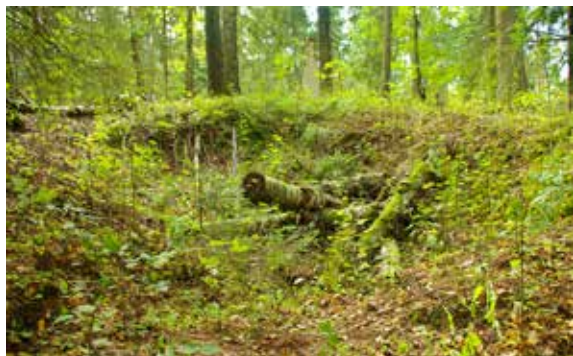
6 pav. Vanagų karinėje stovykloje įrengtos žeminės 1 – maisto atsargų saugyklos – duobė iš Š. G. Petrausko nuotr.

Fig. 6. The pit from dugout I – the food reserve repository that was dug at the Vanagai military camp, as seen from the N