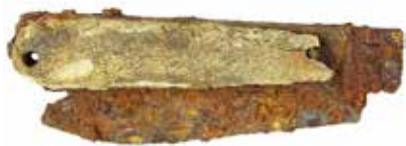
3 pav. Pamedžių (Montvidinės) miško bunkerio aplinkoje aptiktas lenktinis peiliukas.