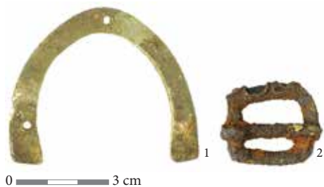
2 pav. Pamedžių (Montvidinės) miško bunkerio aplinkoje aptikti radiniai: 1 – bato pasagėlė; 2 – amunicijos dirželio sagtelė.