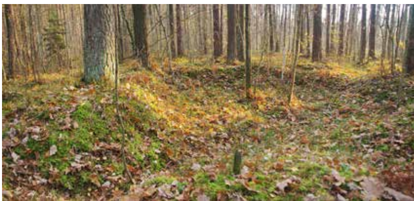
Fig. 1. The pit of dugout 1 created at the Žadeikiai Forest partisan camp site, as seen from the NE

1 pav. Žadeikių miško partizanų stovyklavietėje įrengtos žeminės 1 duobė iš ŠR. G. Petrausko nuotr.