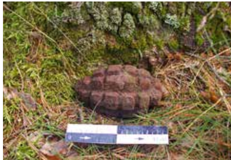
Fig. 9. A Mosin carbine bore brush discovered in the Vanagai military camp

10 pav. Vanagų karinėje stovykloje aptikta rankinė granata F-1.