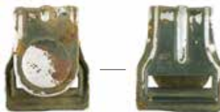
Fig. 11. A parachute ring discovered in the Vanagai military camp

11 pav. Vanagų karinėje stovykloje aptiktas parašiuoto žiedas. G. Stirbos nuotr.