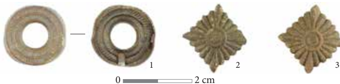
Fig. 13. Finds discovered in the Vanagai military camp: 1 – Part of a cap badge; 2, 3 – shoulder insignia

13 pav. Vanagų karinėje stovykloje aptikti radiniai: 1 – kokardos dalis; 2, 3 – uniformos antpečių ženkliai.