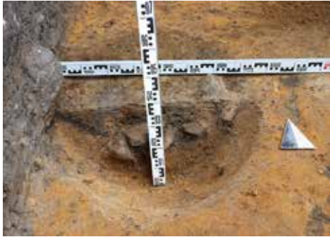
5 pav. XVI–XVII a. ūkinės duobės pjūvis šurfe 9

Fig. 5. The cross-section of the 16 th –17 th -century storage pit in Test Pit 9, as seen from the S.