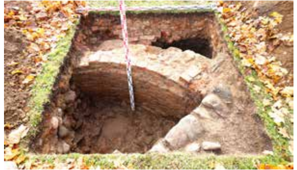
7 pav. Senosios (amatininkų) sinagogos pamato fragmentas XIX a. šurfe 16 iš Š. I. Čičiurkaitės nuotr.

Fig. 5. The cross-section of the 16 th –17 th -century storage pit in Test Pit 9, as seen from the S.