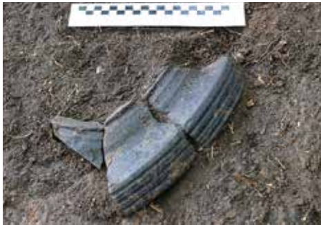
12 pav. XVII a. dubuo in situ iš P. I. Čičiurkaitės nuotr. Fig. 12. A 17 th -century basin in situ, as seen from the S.

Vėlyvi XIX–XX a. pradžios kultūriniai sluoksniai aptikti visuose šurfluose iškart po velėnos ir dirvožemio sluoksniais, jų storiai labai varijuoja, siekia nuo keleto centimetrų PR parko dalyje iki 2 m buvusio miesto kvartalo vietoje, parko ŠV dalyje, kur pastatai nugriauti po II Pasaulinio karo.