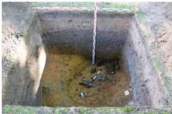
3 pav. XV a. pradžios židinyš šurfe 5 iš Š. I. Čičiurkaitės nuotr.

Fig. 3. The early 15 th -century hearth in Test Pit 5, as seen from the N.