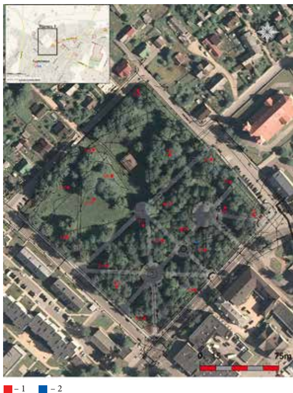
2 pav. 2021 m. archeologinių tyrimų Švenčionių miesto centriname parke situacijos planas: 1 – 2021 m. archeologinių tyrimų šurfai; 2 – 1995 m. V. Semėno tyrimai. R. Kraniausko brėž.

Archeologinių tyrimų metu iki įžemio arba iki struktūrų lygio ištirta 20 2x2 m (4 m 2 ) dydžio šurfų, iš viso 80 m 2 plotas. Šurfų vietas sąlygojo miesto parko išplanavimas, esami takeliai, medžiai ir kiti objektai. Visi šurfai tirti žaliosiose zonose, orientuoti Š–P kryptimi. Šurfų vietas stengtasi diferencijuoti ir pozicionuoti vadovaujantis 1848 m. tikrosios būklės miesto planu taip, kad būtų aptikti skirtingi miesto