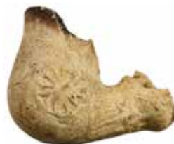
Fig. 14. A 17 th -century earthenware pipe bowl.