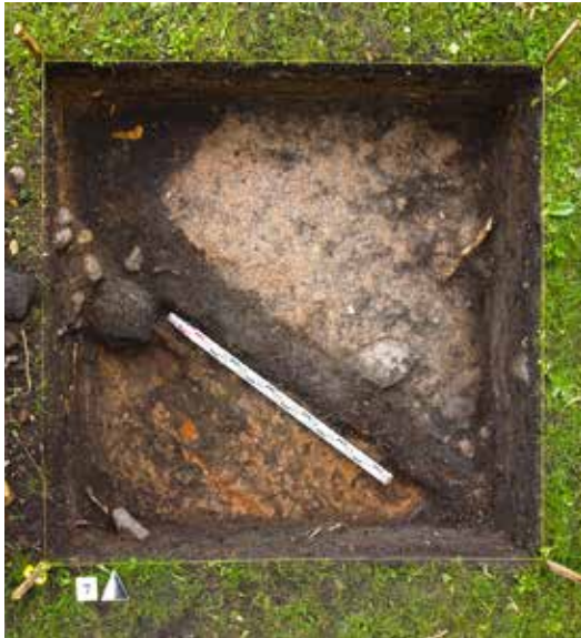
6 pav. XVII a. asla ir sienojas šurfe 7 iš viršaus.

Fig. 7. A fragment of the 19 th -century Old (Craftsmen) Synagogue foundation in Test Pit 16, as seen from the N.